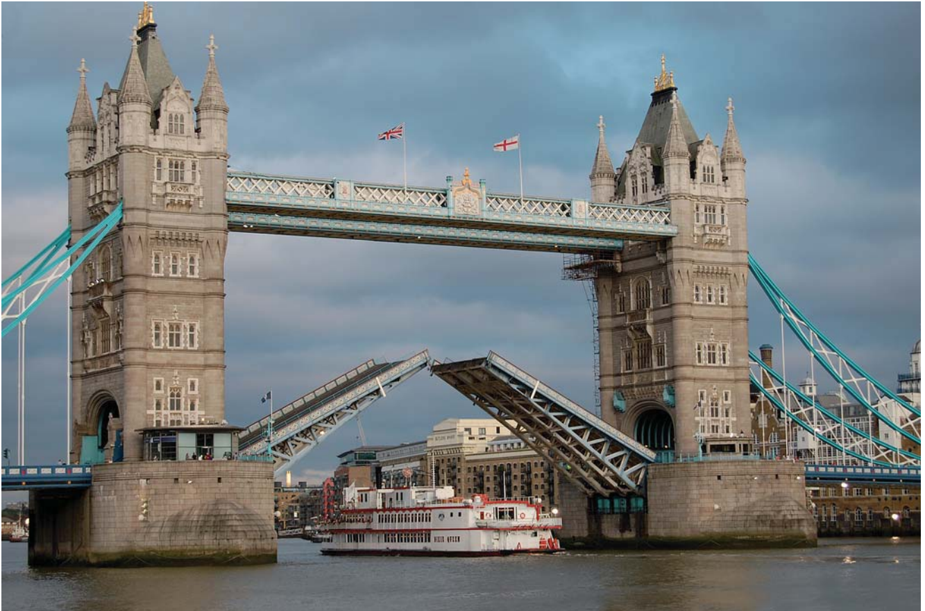
Fig. 3. London Tower Bridge – characteristic tourist attraction • Londyn Tower Bridge – charakterystyczna atrakcja turystyczna

Whereas, when it comes to physical distance, the issue is more serious. Practically speaking, in fact rarely is used the concept of distance between two points, and its derivatives (for example travel costs), reducing the scope of this criterion only to the needs of crossing specific administrative boundaries. Therefore, in the case of international migration it will be a state border.