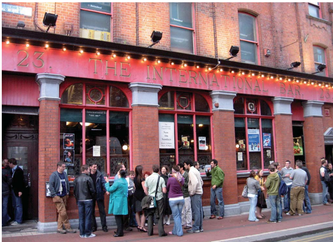
Fig. 2. Dublin – leisure activities by residents and profit visitors • Dublin – sposób spędzania czasu wolnego przez mieszkańców i turystów zarobkowych

Territorial migration/mobility is treated here as a movement for some distance. The most important is however, to determine what exactly is meant by the terms: starting point and a destination, and in overcoming distance. In the first two issues dominate the practical issues, the perception of the area by the administrative functions that it fulfills.