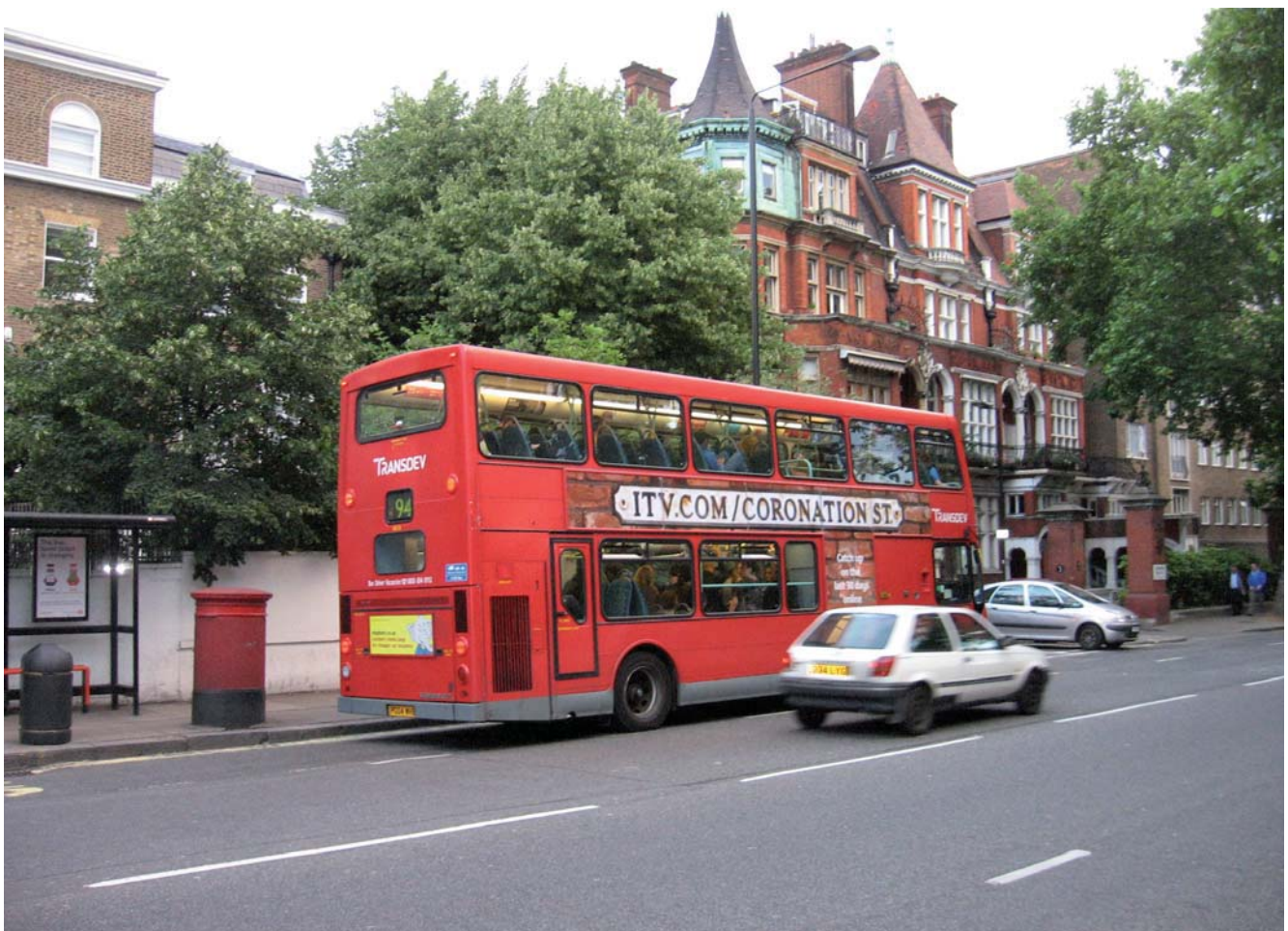
Fig. 1. London – on the way to work • Londyn – w drodze do pracy

In many scientific studies on migration appear definitions connected with it, these are immigration and emigration. In order to accurately use the above terminology the appropriate is an explanation of these three concepts.