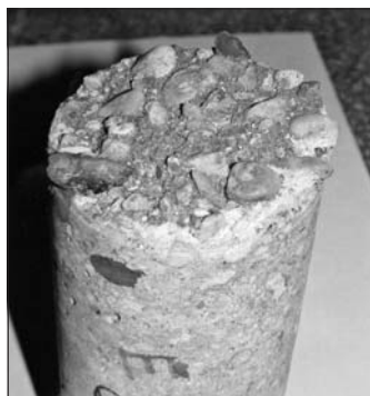
Rys. 5. Widok skorodowanej wewnętrznej powierzchni rdzenia betonowego pobranego z żelbetowego trzonu komina

Przypowierzchniowe partie (plastry) o grubości 5÷50 mm o zmienionym odczynie (zakwaszone) przeznacza się do badań chemicznych. Do badań tych wykorzystuje się również odspojone produkty korozji betonu od strony wnętrza komina oraz gruz powstały po zgnieceniu próbek w trakcie badań wytrzymałościowych. Przykład korozji wewnętrznej powierzchni trzonu żelbetowego podano na rysunku 5.