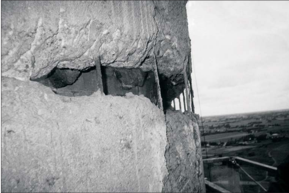
Rys. 1. Widok perforacji żelbetowego trzonu kominu po usunięciu skorodowanej partii betonu

Ostatnio badania z wykorzystaniem betonowych rdzeni pobranych z trzonu nośnego kominu za pomocą specjalnej wiertnicy (por. np. [3–5]) stają się jedną z podstawowych metod diagnostyki kominów żelbetowych, oprócz szczegółowej inwentaryzacji uszkodzeń i występujących nieprawidłowości. Badania te umożliwiają uzyskanie dokładnych danych dotyczących stanu technicznego kominu. Dotyczą one oceny rzeczywistej grubości ściany trzonu żelbetowego w stosunku do założeń projektowych, określenia korozyjnych ubytków betonu i uzyskania próbek betonowych do badań laboratoryjnych (fizycznych, chemicznych i wytrzymałościowych) oraz dodatkowo oceny rodzaju, grubości i stanu izolacji termicznej, a także wymurówki wewnętrznej.