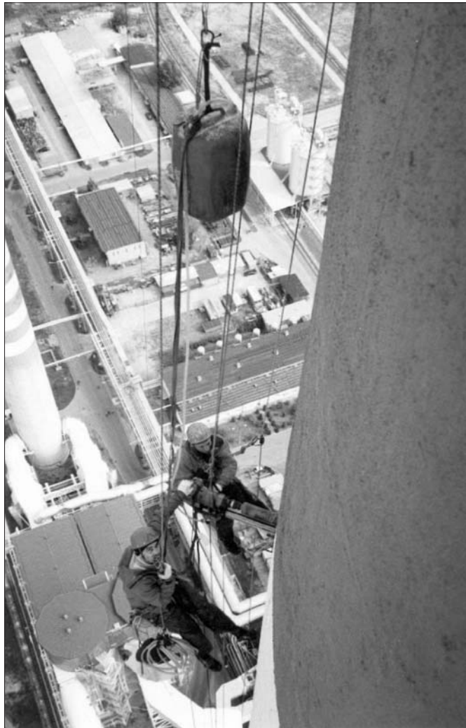
Rys. 3. Pobieranie rdzeni betonowych pomiędzy galeriami na poziomie +140 m

W koniecznych przypadkach, gdy nie ma możliwości dokonania przeglądu wnętrza (ciągła praca komina), wskazane jest także pobranie, za pomocą wiertnicy, próbek wymurówki wewnętrznej.