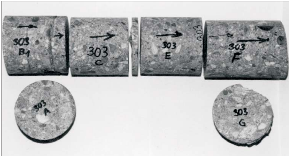
Rys. 4. Widok pociętego na próbki rdzenia betonowego

Wynik jednego z powyższych testów umożliwia podjęcie decyzji o pocięciu rdzeni na „plastrowe” próbki badawcze (rys. 4), nieodzowne do przeprowadzenia laboratoryjnych badań chemicznych.