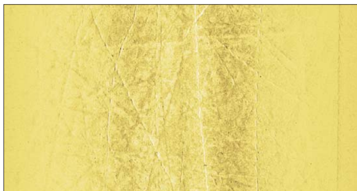
Rys. 4. Efekt trałowania (obraz sonarowy)

Niebezpiecznym i zagrażającym czynnikiem dla środowiska oraz ludzi jest możliwość potencjalnego występowania w tym rejonie bojowych środków trujących (BST). Sam rejon bezpośrednio nie sąsiaduje z miejscem zrzutów amunicji (akwen położony na południowy wschód od Gotlandii), natomiast leży w bliskim otoczeniu tras przewożenia ładunków do miejsca zrzutów. W dokumentacjach oraz danych dotyczących tego proceduru występuje mnóstwo niejasności i rozbieżności dotyczących: dokładnej pozycji zrzutów, ilości zatopionego materiału i sposobu zatapiania. Prawdopodobnie, początkowo nie wyjmowano topionego sprzętu ze skrzyń drewnianych, co powodowało ich dryfowanie, pomiar pozycji odbywał się za pomocą kompasu i namiarów z lądu, zrzut następował ze statków płynących lub dryfujących, część amunicji z BST była topiona już w czasie rejsów. Takie informacje potwierdzają liczne Locje Bałtyku, raporty, oraz publikacje [4], a przede wszystkim faktyczne kontakty BST z ludźmi w różnych miejscach Bałtyku, nawet znajdujących się w znacznych odległościach od oficjalnie podanych miejsc zrzutów. Zatem istnieje potrzeba zachowania szczególnej ostrożności w tym rejonie przy prowadzeniu wszelkich prac morskich, a przede wszystkim przy pobieraniu prób osadów.