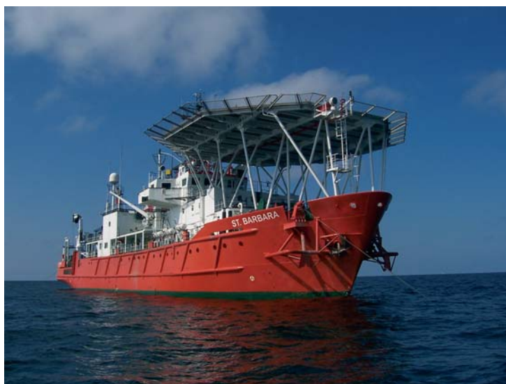
Rys. 5. M/V St. Barbara

Badania geologiczno-inżynierskie, geofizyczne, oraz hydrograficzne wykonała w marcu 2003 roku Służba Geotechniki i Radiogeodezji Petrobaltic S.A. Wszystkie badania na morzu prowadzono z pokładu wielozadaniowego statku badawczego M/V St. Barbara (rys. 5). Jednostka jest typowym pełnomorskim statkiem badawczym, mogącym zapewnić kompleksowe przeprowadzenie badań z zakresu geotechniki, geofizyki i hydrografii. Mobilność statku zapewniają cztery silniki główne i dwa stery strumieniowe. Stabilność pozycji, mimo działających sił wymuszających (wiatr, prąd i falowanie) zapewnia kotwiczny system utrzymywania pozycji. Dla zapewnienia dokładnej lokalizacji wszystkie prace badawcze wykonywane są pod nadzorem dwóch oddzielnie działających systemów nawigacji radiowej DGPS, oraz specjalistycznego oprogramowania nawigacyjnego NORCOM. Do zadań prowadzonych pod powierzchnią wody jednostka posiada system akustycznego pozycjonowania podwodnego. Wysoką specjalizację statku, oraz przydatność w koordynowaniu pracami podwodnymi na polach naftowych B3 i B8 podkreśla zainstalowany zespół telewizji do nadawania lokalnej transmisji obrazu i informacji z prowadzonych prac, których bezpieczne i skuteczne przeprowadzenie wymaga zgrania wszelkich działań na różnych jednostkach morskich znajdujących się na polu naftowym.