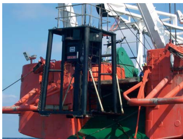
Rys. 6. Penetrometr Roson

Na podstawie wyznaczonych charakterystyk mechanicznych gruntu sporządzono dokumentację geotechniczną i w formie ekspertyzy przekazano do firmy Petrobaltic.