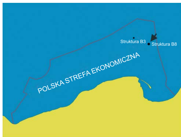
Rys. 1. Położenie rejonu badań

Dokumentowany rejon badań położony jest w obszarze Polskiej Strefy Ekonomicznej Morza Bałtyckiego (rys. 1), w części wschodniej Bałtyku Południowego, około 60 km na północny wschód od przylądka Rozewie i około 70 km na północ od cypla Półwyspu Helskiego, zajmując część Progu Gotlandzko-Gdańskiego.