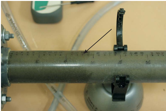
Rys. 5. Widok przyrządu Kaczyńskiego na stanowisku badawczym (zbliżenie przesuwającego się frontu zawilgocenia wraz z naniesioną skalą pomiarów)