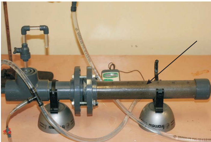
Rys. 3. Widok przyrządu Kaczyńskiego na stanowisku badawczym; w punkcie zaznaczonym strzałką widać front przesuwanego się zawilgocenia

Naczynie przelewowe zamocowano na statywie i połączono ze zbiornikiem doprowadzającym wodę za pomocą giętkiego węża. Połączenie jest tak wykonane, aby możliwa była swobodna regulacja ciśnienia ( h_0 ). W późniejszym okresie planuje się zastosowanie pompy o niewielkim wydatku do uzupełniania cieczy w naczyniu przelewowym. Na rysunkach 3–5 przedstawiono elementy przyrządu Kaczyńskiego na zbudowanym stanowisku badawczym.