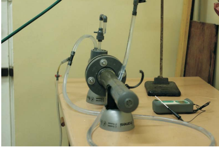
Rys. 4. Widok przyrządu Kaczyńskiego na stanowisku badawczym od strony frontowej rury poziomej