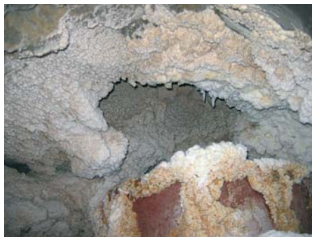
Rys. 1. Sole wtórnej krystalizacji w rejonie wylotu otworu TP-17

Dopływ wody z zewnątrz do każdej kopalni soli stanowi poważne zagrożenie, dlatego dąży się do jego zminimalizowania [3]. Są różnorodne przyczyny [1, 4], które w pewnym momencie doprowadzają do wycieków w kopalniach. Dla ukazania przedmiotowego problemu i sposobu ograniczania dopływu wody z powierzchni wybrano otwór podsadzkowy TP-17 w Kopalni Soli „Wieliczka” [2]. Został on wykonany ponad 30 lat temu i służył do podsadzania części wyrobisk kopalni. Od dłuższego czasu prawdopodobnie otworem tym do wnętrza kopalni soli dostaje się woda. Dla ograniczenia tego niekorzystnego oddziaływania wody na złożo wcześniej przeprowadzono z powierzchni terenu likwidację jego górnej części. Jednakże czas pokazał, że nie osiągnięto założonego celu i w dalszym ciągu w rejonie komory Lebzeltern występowały dopływy wody (rys. 1).