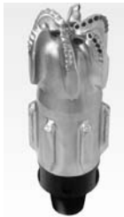
Rys. 2. Świder serii BX 5xx firmy Hughes Christensen Co.

Projekty wiercenia otworów przewidywały, że wiercenie narzędziami PDC prowadzone będzie w przedziale głębokości od ok. 1300 m do ok. 2200 m. W tym interwale wiercono świdrami PDC o średnicy 12 \frac{1}{4} ". Następny przedział głębokości, w którym używano pełnoprzekrojowych narzędzi PDC to wiercenie pomiędzy głębokościami 2200 m a 2600 m. Ten przedział głębokości wiercono narzędziami PDC o średnicy 8 \frac{1}{2} ". W analizowanych interwałach wiercenia otworów pracowały narzędzia firm Hughes Christensen Co.: serii BX 5xx (rys. 2) i DBS Security (DBS): serii FM 2000 (rys. 3).