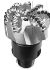
Rys. 3. Świder serii FM 2000 firmy Security DBS