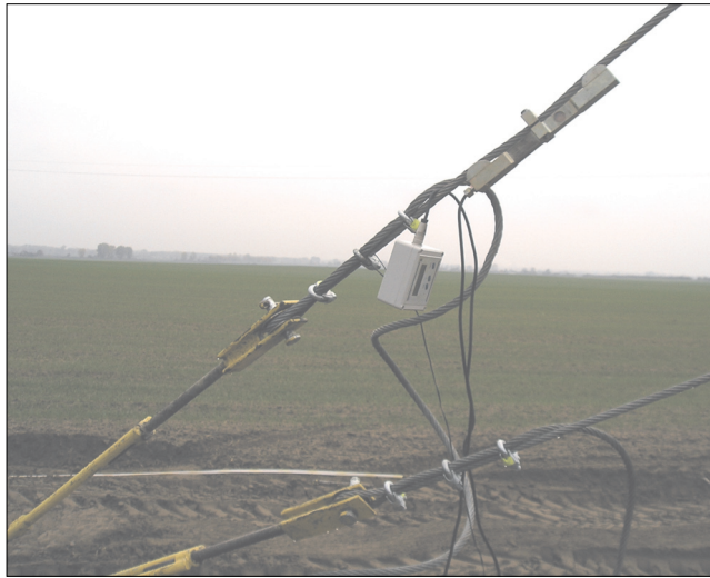
Rys. 3. Pomiar napięcia w linie odciągowej

wyposażeniu LBAUWiE Wydziału WNiG AGH (rys. 3), przystosowanego do pomiaru napięcia w linach odciągowych \varnothing 16 mm, \varnothing 18 mm, \varnothing 22 mm i \varnothing 25 mm. Po sprawdzeniu mocowania wszystkich elementów podlegających obciążeniu, przystąpiono do próby obciążeniowej wg przyjętego programu (tab. 2).