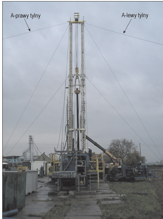
Rys. 1. Maszt teleskopowy MT-21/1 urządzenia wiertniczego Cooper LTO 150

Na maszt z linami odciągowymi mogą oddziaływać następujące obciążenia: