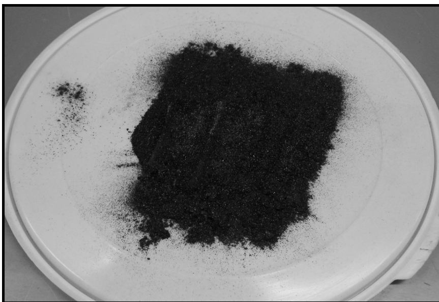
Rys. 1. Grafit płatkowy wykorzystany do badań

Spośród szerokiej gamy dostępnych na rynku cementów wybrano CEM II/B-V 32,5 R. Jest to cement portlandzki popiołowy klasy 32,5 z dodatkiem lotnego popiołu krzemionkowego. Głównymi kryteriami wyboru danego cementu były jego cena oraz ogólna dostępność w porównaniu z zaawansowanymi cementami stosowanymi w wierceniach naftowych. Mimo spełnienia tych warunków cement CEM II/B-V 32,5 R jest środkiem wykazującym się odpowiednimi właściwościami, tj. niskim skurczem, wysoką wytrzymałością w długich okresach dojrzewania oraz korzystnym wpływem na pompowalność zaczynu.