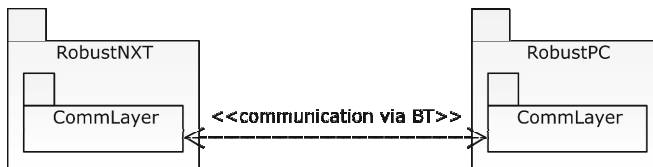
Rys. 1. Platforma Robust

Platforma Robust składa się z dwóch głównych części: programu sterującego kostką NXT, oraz biblioteki rezydującej na komputerze klasy PC i zapewniającej komunikację ze sprzętem (rys. 1). Obie części są napisane w Javie , przy czym część rezydująca na Mindstorms NXT ( RobustNXT ) działa w środowisku Lejos , natomiast do skorzystania z biblioteki ( RobustPC ) wystarczy posiadanie dowolnej maszyny wirtualnej Java w wersji 6 kompatybilnej z aktualnie używanym systemem operacyjnym.