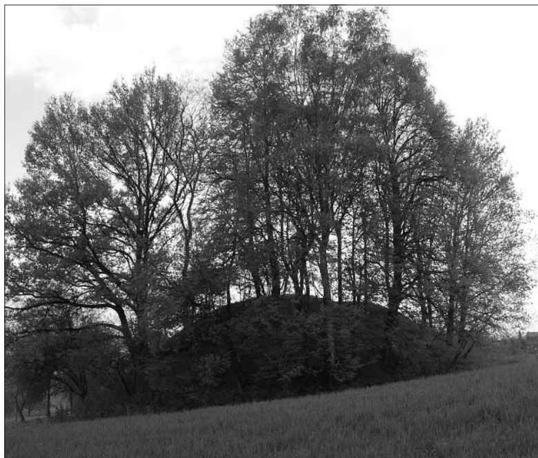
Rys. 1. Kopiec Kraka w Krakuszowicach, widok od strony północnej

zrównanie dnia z nocą (ok. 21 III), przesilenie letnie Słońca (ok. 22 VI), jesienne zrównanie dnia z nocą (ok. 23 IX) i przesilenie zimowe (ok. 22 XII). Tak wyznaczone daty dzielą rok na osiem w przybliżeniu równych części.