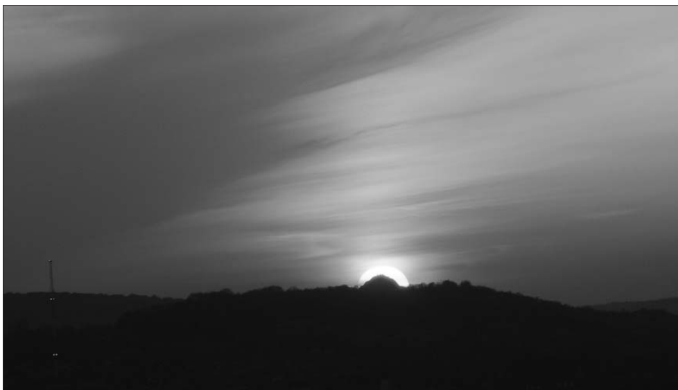
Rys. 2. Zachód Słońca na tle kopca Kościuszki widziany z kopca Krakusa w dniu 27 kwietnia 2006 r.

się w płaszczyźnie horyzontu Krakowa. Przy dobrej widoczności z kopca Wandy można zobaczyć za pomocą lornetki kopiec Krakusa. Należy go szukać na horyzoncie w sektorze ograniczonym z lewej strony przez chłodnie kominowe, a z prawej przez komin EC Łęg. W rzeczywistości kopiec Wandy nie jest widoczny z kopca Krakusa, gdyż jego bryłę przesłaniają drzewa, a jego wierzchołek zlewa się na horyzoncie z drzewami oraz zabudowaniami huty.