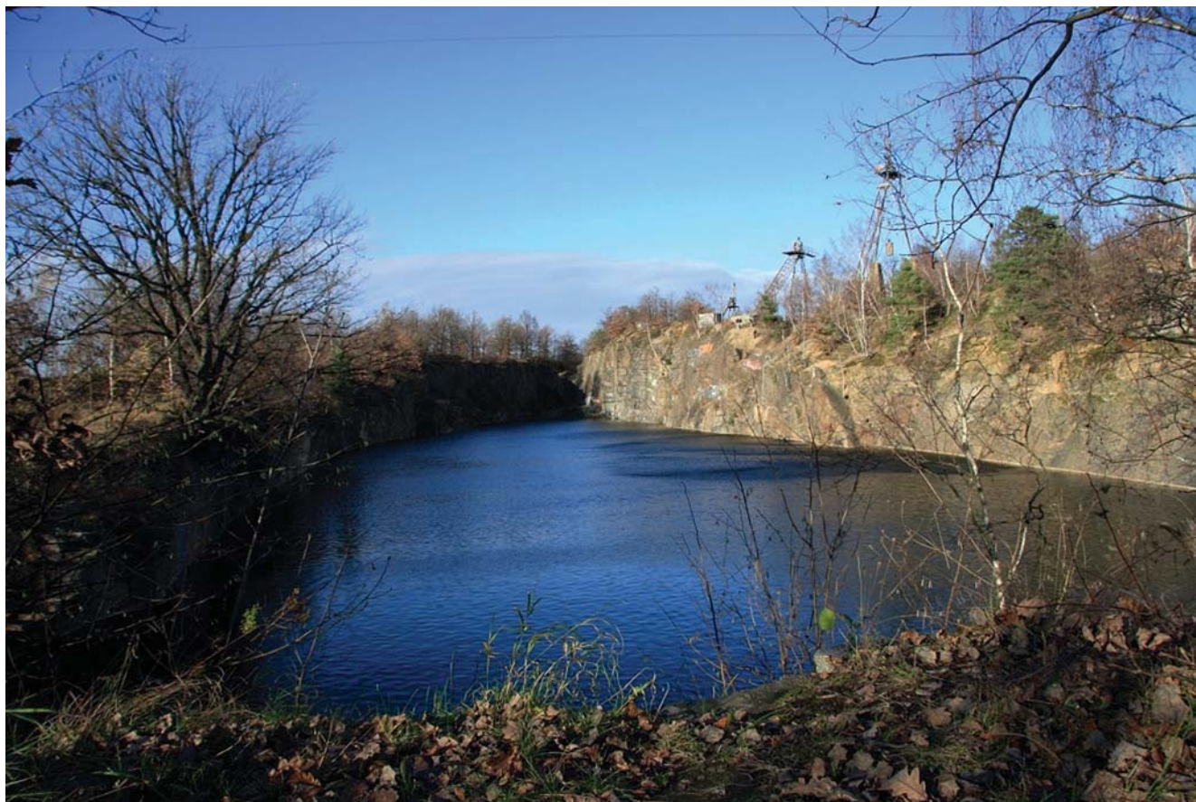
Fig. 9. Widok na kamieniołom w Chwałkowie • General view of the Chwałków quarry