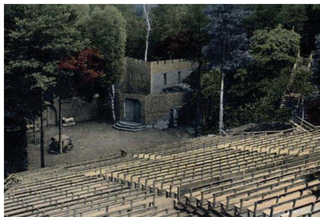
Fig. 3. Amfiteatr usytuowany w prehistorycznym kamieniołomie • The amphitheater located in historical quarry

W latach siedemdziesiątych XX wieku powstały nieicne projekty, które pozwoliły na zagospodarowanie dawnych wyrobisk. Były to między innymi Kadzielnia w Kielcach, Sobótka, Góra Św. Anny (Pietrzyk-Sokulska 2003).