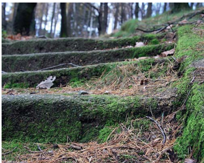
Fig. 6. Schody prowadzące do kamieniołomu „Harcerskiego” • Stairs to the “Scout Quarry”

Jeszcze inną grupą, z powodzeniem korzystającą z możliwości jakie daje kamieniołom, są pasjonaci nurkowania. Szczególną atrakcją przyciągającą ich właśnie w to miejsce jest możliwość oglądania na znacznej głębokości pozostawionego na dnie kamieniołomu górniczego sprzętu, maszyn, narzędzi itp.