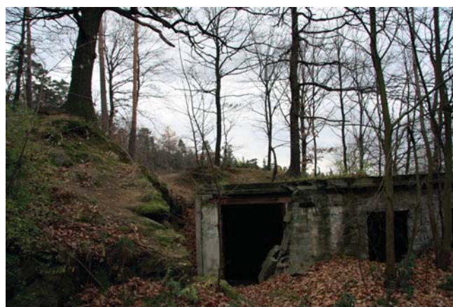
Fig. 4. Ruiny po zabudowie scenicznej amfiteatru • Remains of stage construction in the amphitheatre

W latach 1925–1926, w nieczynnym już od dawna wyrobisku, został wybudowany amfiteatr (Fig. 3), w którym aż do 1945 r. odbywały się liczne spotkania i imprezy plenerowe. Na początku 1945 r. amfiteatr ten został rozebrany przez wojska hitlerowskie na materiał do budowy linii obronnych.