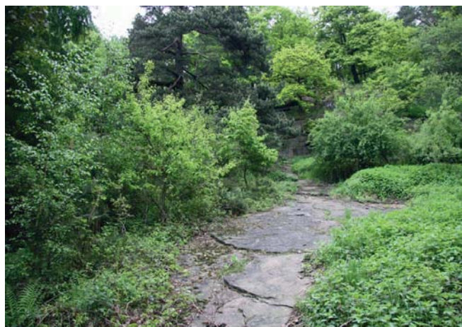
Fig. 2. Granitowa ściana Kamieniołomu Harcerskiego • Granite wall in the “Scout Quarry”

Funkcje nieczynnych kamieniołomów w krajobrazie mogą być różne, jednakże w większości przypadków uzależnione są od fizjografii terenu, a co się z tym wiąże od lokalizacji, rodzaju wydobywanej kopaliny, indywidualnego charakteru oraz od historii wyrobiska. Warto w tym miejscu wspomnieć, że kamieniołomy jako wyrobiska górnicze wchodzą w skład szeroko pojętego dziedzictwa górniczego, a ono na świecie rozpatrywane jest jako dziedzictwo kulturowe i bywa wpisywane na Listę Światowego Dziedzictwa Kulturowego i Przyrodniczego UNESCO (Lorenc, 2010; Lorenc, Janusz, 2010; Lorenc, Cocks, 2008; Pérez Sánchez, Lorenc, 2008).