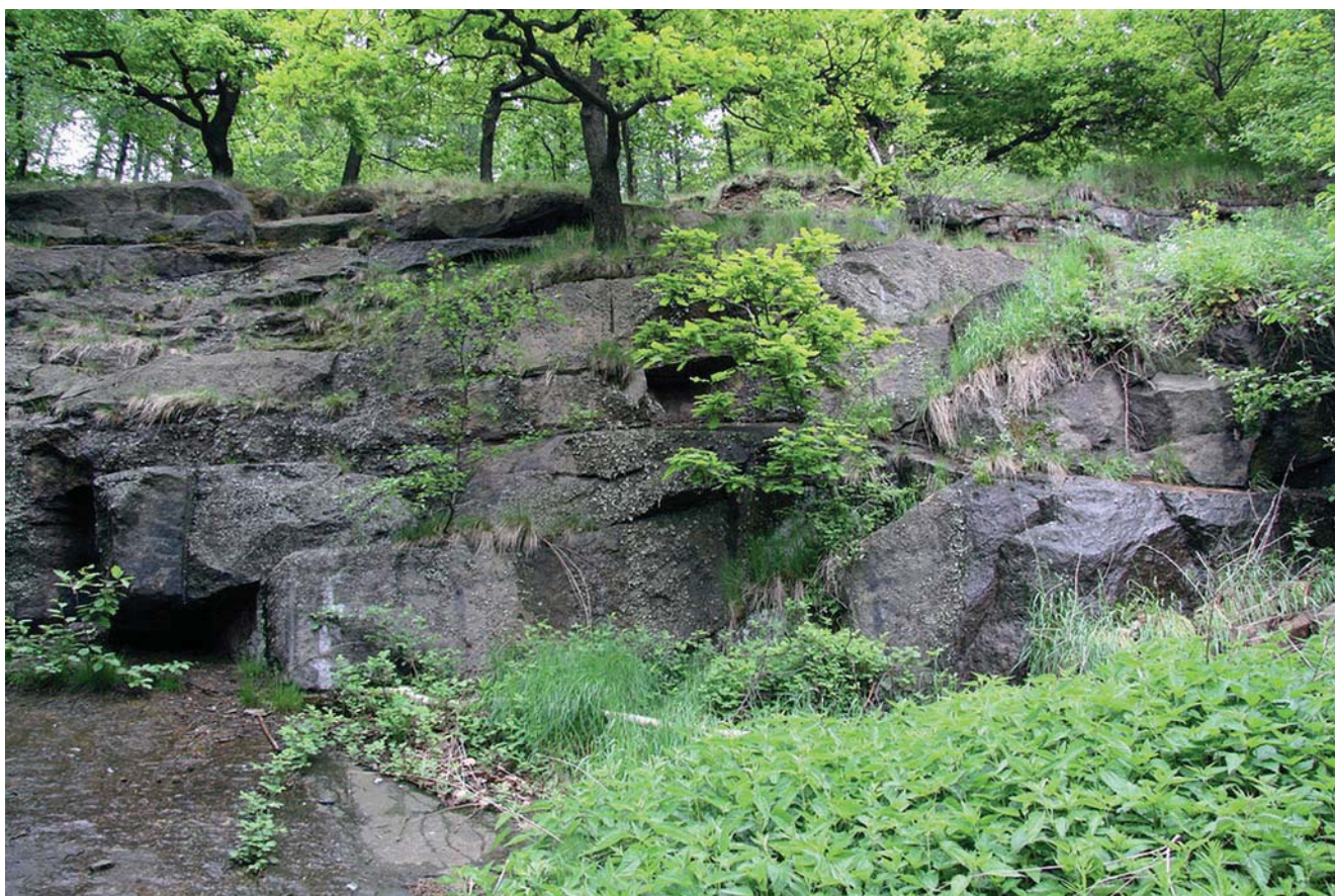
Fig. 5. Zarośnięty Kamieniołom Harcerski, fot. M.W. Lorenc • The “Scout Quarry” covered with vegetation, phot. M.W. Lorenc