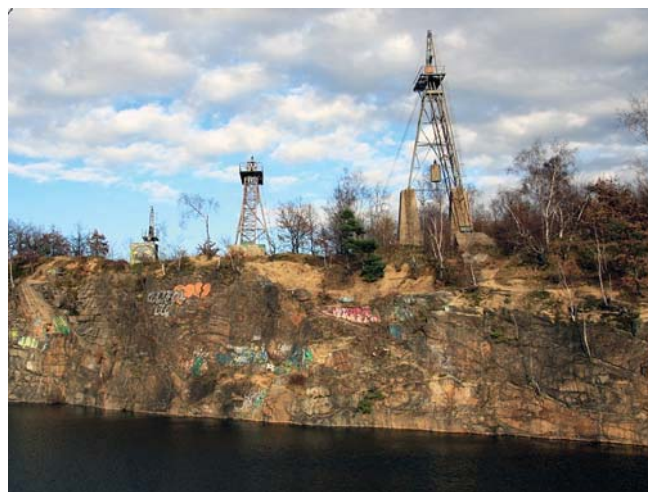
Fig. 7. Skalna ściana opuszczonego kamieniołomu w Chwałkowie • Wall of abandoned granite quarry in Chwałków