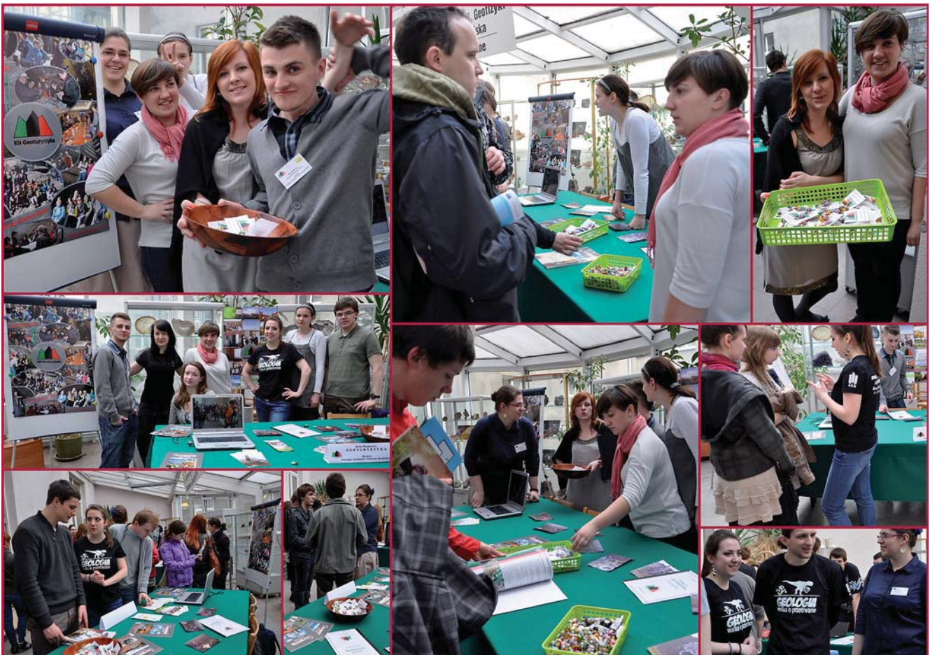
Fig. 1. A busy day at the Open Days of the AGH-UST. See you in Spring, 2013 • Pracowity dzień na Dniach Otwartych AGH. Zapraszamy ponownie wiosną 2013 roku

An important activity of our group is the work on geotourist projects. In 2012 we run the II stage of project granted by the Rector of the AGH-UST. The project aims to develop the information boards for the Ojców National Park. We intend to design the new boards explaining to the visitors some geological processes, which can be observed at specific sites in the park selected by park authorities.