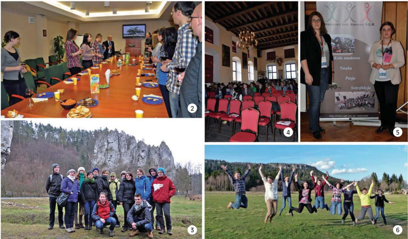
Fig. 2. The Argentinian Evening • Wieczór argentyński