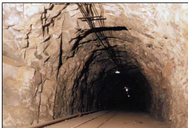
Rys. 4. Kopalnia „Guido” — przekop na poziomie 170

Kopalnia „Guido” jest dwupoziomowa, z poziomami na 170 m (rzędna + 83,4 m) i 320 m (rzędna – 61,7 m). Łączna długość wyrobisk wynosi 2430 m, z czego 400 m przypada na poziom 170 m, a około 2030 m na poziom 320 m [11, 12]. Na poziomie 170 m znajdują się zabytkowe wyrobiska górnicze (wykonane w latach 1860–1870), zwłaszcza duże komory, które zostały odremontowane i zabezpieczone dla celów muzealnych w latach 80. XX w. Na poziomie 320 m znajduje się system wyrobisk (przekop i chodniki w pokładzie węgla 620, szereg komór o powierzchni 25\div 200 \text{ m}^2 oraz ściana eksploatacyjna).