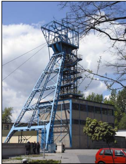
Rys. 3. Kopalnia „Guido” — szymb „Kolejowy” (widok obecny)

W obrębie kopalni „Guido” występują utwory czwartorzędu i karbonu. Nadkład, którego miąższość wynosi 20÷50 m, zbudowany jest z piasku i żwiru, przewarstwionych gliną i iłem. Utwory karbońskie reprezentowane są przez warstwy porębskie, które budują warstwy