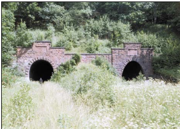
Rys. 4. Tunele w Jedlinie Zdrój. Portale od strony Wałbrzycha