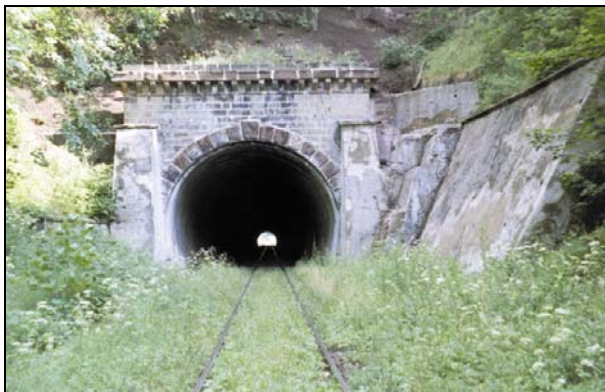
Rys. 6. Tunel w Unisławiu Śląskim. Portal od strony Unisławia Śląskiego