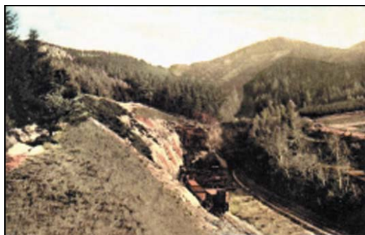
Rys. 2. Tunele pod Małym Wołowcem. Poczтівka z 1911 r.

tuneli pod Świerkową Kopą i Małym Wołowcem, pomiędzy równoległymi komorami tuneli wykonano po trzy sztolnie łączące, umożliwiające odprowadzenie spalin do komina wentylacyjnego.