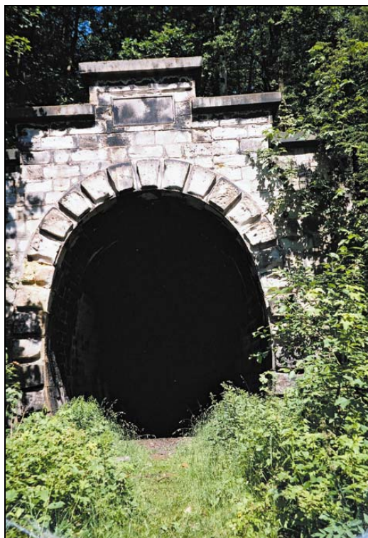
Rys. 3. Tunel pod Małym Wołowcem. Portal od strony Jedliny tor 2