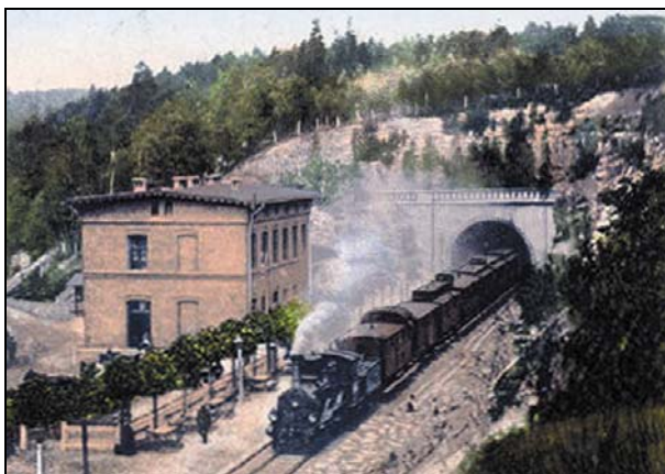
Rys. 7. Tunel w Długopolu. Fragment pocztówki z 1904 r.

Budowę linii rozpoczęto w 1871 roku. Na jej trasie wydrążono tylko dwa tunele, oba dwutorowe.