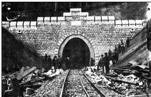
Rys. 8. Tunel pod górą Czyżyk. Zdjęcie z 1909 r. [2]

Budowę linii prowadzono w latach 1905–1909. Na stosunkowo krótkim odcinku tej linii, pomiędzy miejscowościami Pilchowice Zapora – Wleń, wydrążono trzy jednotorowe tunele. Pierwszy z nich o długości 187 m wydrążono pod górą Czyżyk (425 m n.p.m. — rys. 8).