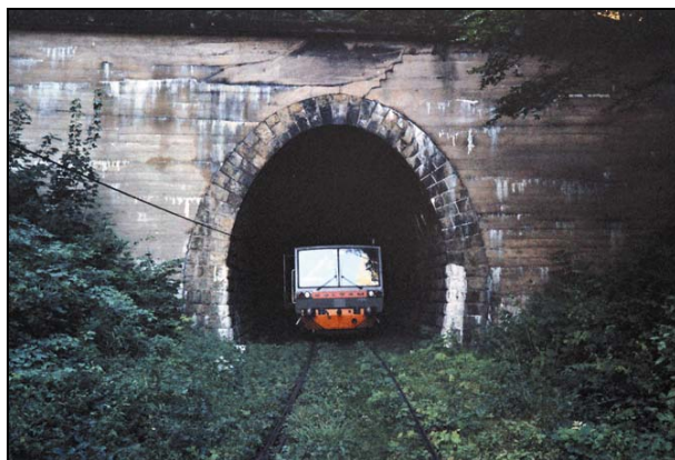
Rys. 9. Tunel pod górą Czyżyk. Zdjęcie z 2003 r.

Tunele te jako jedyne na Dolnym Śląsku ucierpiały na wskutek działań wojennych — ich portale zostały wysadzone przez dywersantów niemieckich. Po wojnie portale tuneli zostały odtworzone w obudowie żelbetowej (rys. 9).