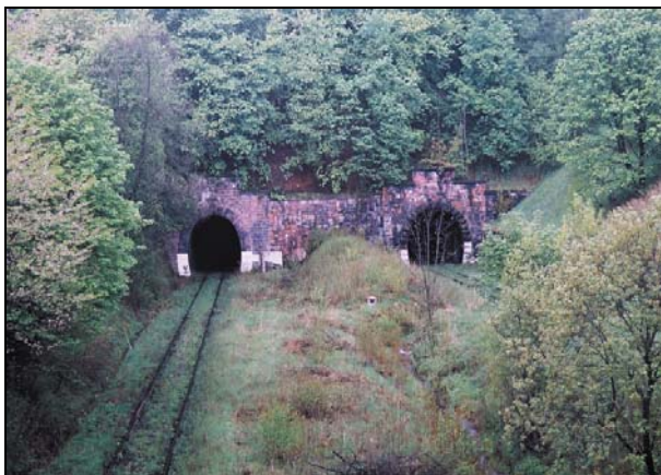
Rys. 5. Tunele w Świerkach. Portale od strony miejscowości Świerki