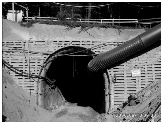
Rys. 1. Portal południowy