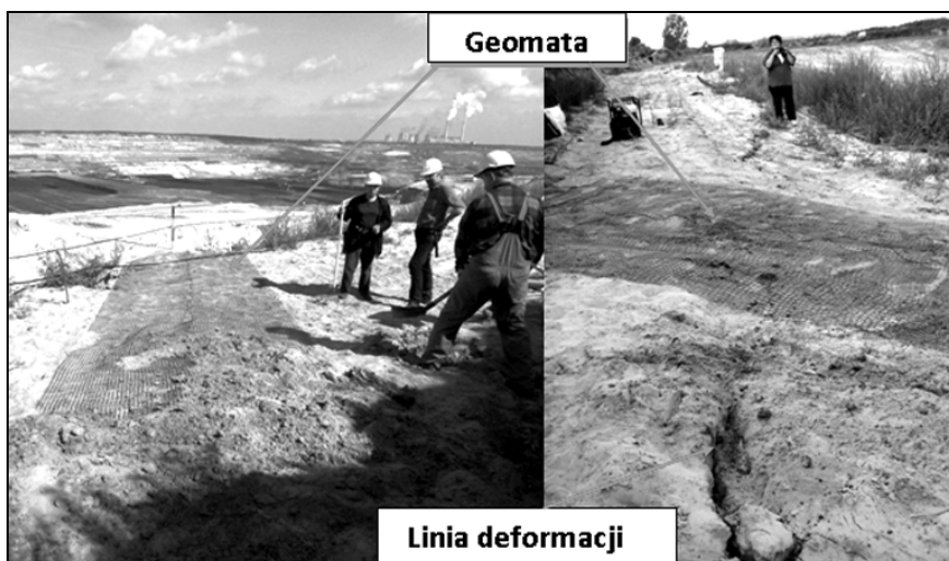
Rys. 2. Instalacja geomaty

i wyników pomiarów. Zainstalowana geomata miała wymiary 10 \times 2 m. Ułożona została na wcześniej przygotowanym terenie, w miejscu gdzie zaobserwowano największe deformacje (rys. 2). Następnie dociążono ją piaskiem i wykonano pomiar referencyjny, do którego porównywane były dalsze pomiary.