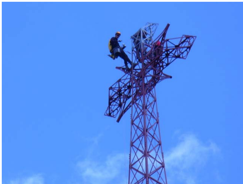
Rys. 11. Zabezpieczanie antykorozyjne krzyża.

Jednocześnie zostały podjęte próby zabudowy kotew o średnicy 20 mm, scalających fundament z podłożem. Okazało się, że pomimo prowadzonych naprzemiennie wierceń i iniekcji, efektywne wiercenie jest praktycznie niemożliwe. W tej sytuacji zdecydowano o wykonaniu odkrywki w północno-wschodnim narożniku fundamentu, która dowiodła, że wewnątrz fundamentu pod cienką warstwą wylewki betonowej wypełnione jest w większości drobnym rumoszem wymieszanym lokalnie z humusem. Została więc podjęta decyzja o usunięciu górnej warstwy fundamentu o grubości około 30 cm. Umożliwiło to efektywniejsze prowadzenie zarówno robót kotwionych, jak i iniekcyjnych. We wszystkich narożach (dłużcach) krzyża zostały zabudowane kolejno kotwy o średnicy 20 mm i długości około 2 m oraz wykonane prace iniekcyjne scalające rumosz stanowiący wypełnienie konstrukcji fundamentu. Tak znaczne obniżenie fundamentu pozwoliło również na lepsze odsłonięcie elementów konstrukcji stalowej posadowionych w pierwotnym fundamencie. Okazało się, że są one bardzo zniszczone korozją, a głębokość wżerów sięga w niektórych przypadkach 4 mm. W tym samym czasie zostało rozpoczęte czyszczenie strumieniowo-sięcierne konstrukcji stalowej.