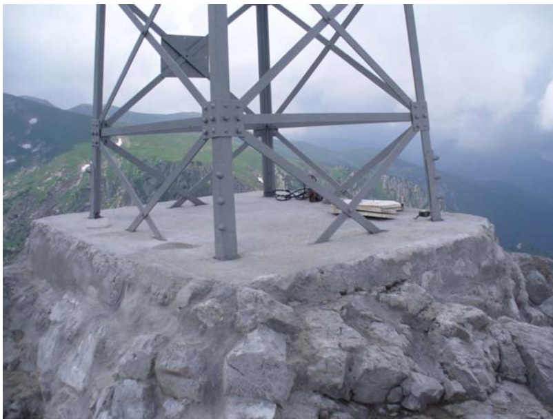
Rys. 12. Obecny wygląd fundamentu wraz z cokołem.