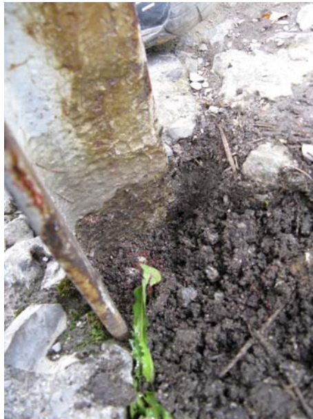
Rys. 8. Mocowanie podłużnicy krzyża w fundamencie w jego części południowo-wschodniej. Widoczna kawerna w betonie wypełniona humusem.