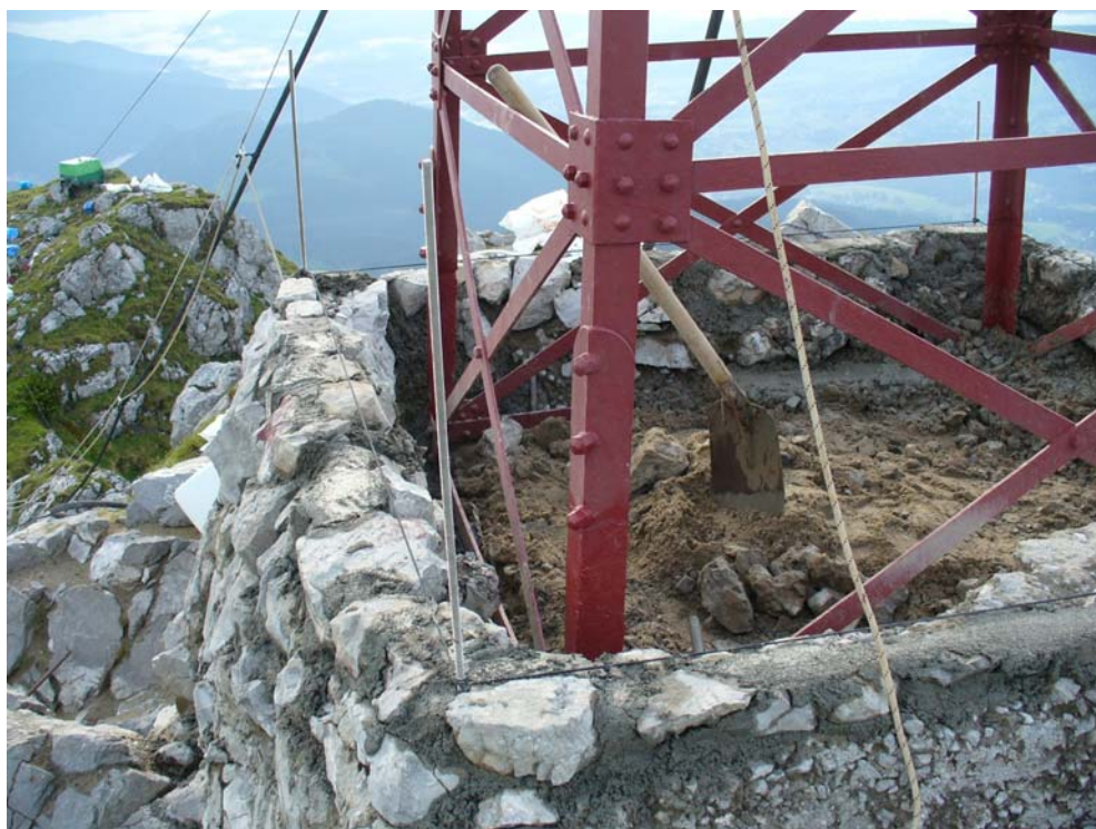
Rys. 10. Prace renowacyjne w podłożu krzyża.

szej fazie zostały wykonane otwory kotwienne o długości około 2 m w południowo-wschodniej części fundamentu. Otwory wiercone były skośnie, w taki sposób, aby połączyć fundament w tej części, gdzie był najbardziej uszkodzony, z sąsiadującym skalnym podłożem. Otwory wykonane były urządzeniem obrotowo-udarowym HILTI TE80 i wiertłami łączonymi segmentowo, o średnicy 36 mm. Po wykonaniu otworów umieszczono w nich kotwy wykonane ze stali nierdzewnej typu A4 i średnicy 20 mm. Kotwy osadzone zostały z zastosowaniem masy zalewowej Sika Gront 311. Po ich zabudowie rozpoczęto czyszczenie z rumoszu i humusu kawerny w południowo-wschodniej części fundamentu. Okazało się, że kawerna jest bardzo rozległa i głęboka. Udało się dotrzeć do konstrukcji stalowej krzyża, nie natrafając na lansze stalowe ani kotwy, które miały być tam zabudowane w 1901 roku, zgodnie z założeniami projektowymi. Konstrukcja stalowa krzyża widoczna w kawernie była bardzo zniszczona przez korozję. Została oczyszczona w możliwym do wykonania zakresie, a następnie stopniowo obudowano ją kamieniem wapiennym z jednoczesnym wypełnieniem pustek zaczynem cementowym [rys. 10].