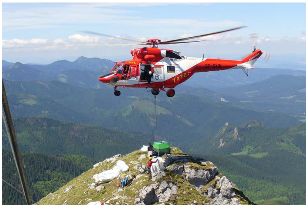
Rys. 9. Transport materiałów śmigłowcem TOPR.

Projektowany optymalny termin rozpoczęcia renowacji na przełomie maja i czerwca 2009 musiał zostać przesunięty ze względu na wciąż leżące śniegi. Rozpoczęto jednak przygotowania do transportu materiałów i sprzętu. Renowacja krzyża była wielkim wyzwaniem logistycznym, sprzęt budowlany i materiały przywiezione z Krakowa zostały zdeponowane w Zakopanem i przy dobrej pogodzie były transponowane śmigłowcem TOPR (rys. 9).