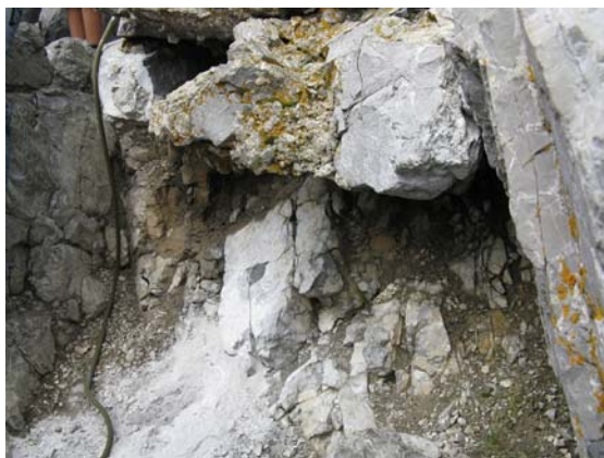
Rys. 5. Kawerna u podstawy fundamentu części zachodniej w zbliżeniu.

W celu rozpoznania stanu fundamentu i skał podłoża pobrano próby skalno-fundamentowe i zaproponowano wykonanie otworów badawczych (rys. 7–8).