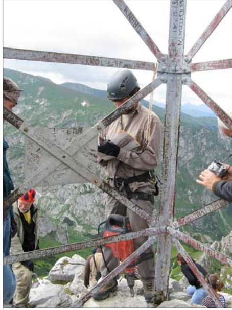
Rys. 7. Wiercenie otworu badawczego 1 w fundamencie krzyża.