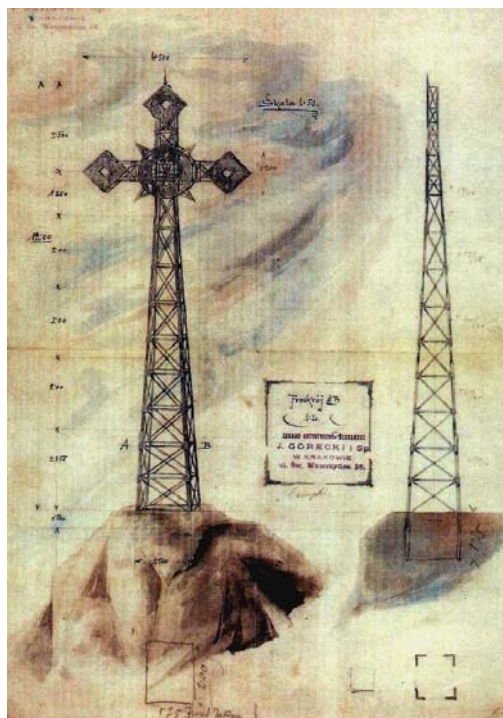
Rys. 1. Pierwotny projekt krzyża na Giewoncie z 1901 roku

Pierwsza wersja krzyża, zaprojektowanego w 1901 roku w Zakładzie Artystyczno-Ślusarskim J. Góreckiego i Spółki w Krakowie, przy ulicy św. Wawrzyńca 26 miała posiadać charakterystyczną dla tamtych czasów dekoracyjną konstrukcję kratownicową (rys. 1).