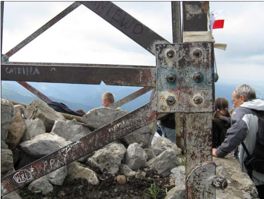
Rys. 4. Miejsce pobrania próbki z konstrukcji stalowej krzyża w jej dolnej części.