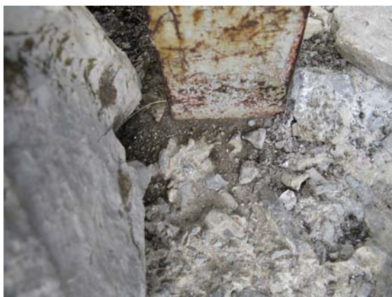
Rys. 6. Mocowanie konstrukcji w części N-W fundamentu.