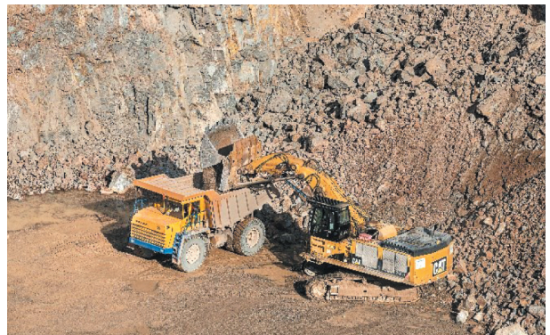
Rys. 10. Jednonaczyniowa hydrauliczna koparka przedsiębiorna CAT 385C FS

Obecnie załadunek prowadzony jest jednonaczyniowymi hydraulicznymi koparkami przedsiębiornymi Caterpillar (CAT) 385C FS (rys. 10) oraz Bola LB-600 (rys. 11).