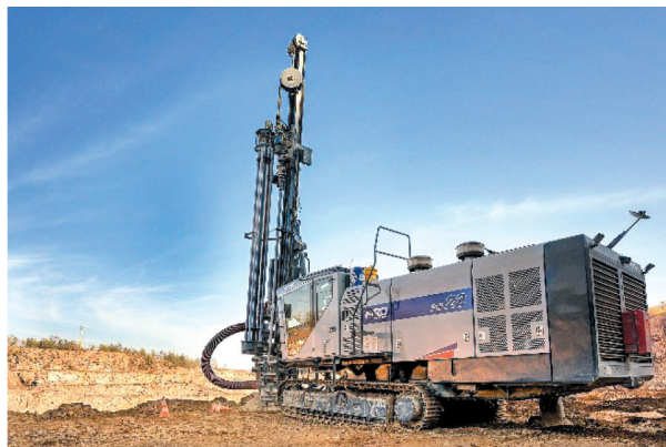
Rys. 6. Wiertnica Furukawa podczas wiercenia

Otwory strzałowe wiercone są japońskimi wiertnicami Furukawa DCR22 (rys. 6) oraz HCR1450.