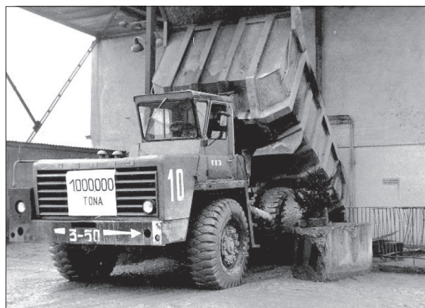
Rys. 3. Milionowa tona – rok 1974

W początkowej fazie funkcjonowania kopalni zakład prowadził produkcję z wykorzystaniem następujących maszyn i urządzeń: kruszarki szczękowe DCJ, kruszarki szczękowe MAKRUM 40.17, kruszarki stożkowe SYMONS 5.5.