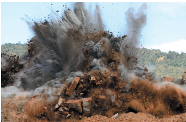
Rys. 5. Roboty strzałowe [5]

Wydobywane w kopalniach skały pochodzenia wulkanicznego są twarde i trudne do mechanicznego urabiania. Jeżeli nie ma przeciwwskazań, to jedynym rozwiązaniem umożliwiającym wydobywanie i produkcję na dużą skalę są wiercenie i strzały (roboty strzałowe) (rys. 5).