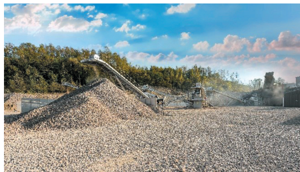
Rys. 14. Zakład produkcji kruszyw mineralnych

W pierwszej kolejności urobek trafia na I stopień kruszenia (wstępne kruszenie) do kruszarek szczękowych DCJ, skąd po wstępnej separacji kierowany jest na II stopień kruszenia (wtórne kruszenie), gdzie zainstalowane są kruszarki szczękowe Metso C-110 oraz kruszarki stożkowe Metso HP-300.