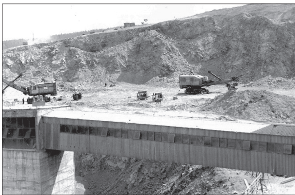
Rys. 2. Początki eksploatacji

W 1972 roku zintensyfikowano prace wykończeniowe nowej kopalni (rys. 2), a jednocześnie szkolono załogę i rozpoczęto rozruch nowego zakładu przerobczego.