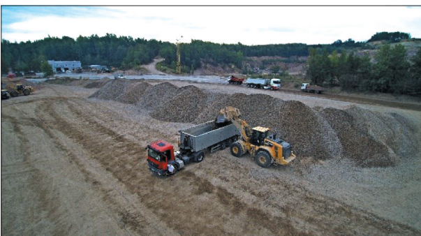
Rys. 16. Załadunek na placu ładowarką CAT 972M

Załadunek materiałów gotowych realizowany jest przez ładowarki kołowe Caterpillar (CAT) 972H, 972M (rys. 18), 980K oraz Hyundai HL-770.