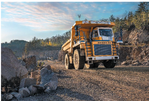
Rys. 13. Woźdło sztywnoramowe Bielaz 75454

Drogi technologiczne stałe usytuowane są między poziomami eksploatacyjnymi.