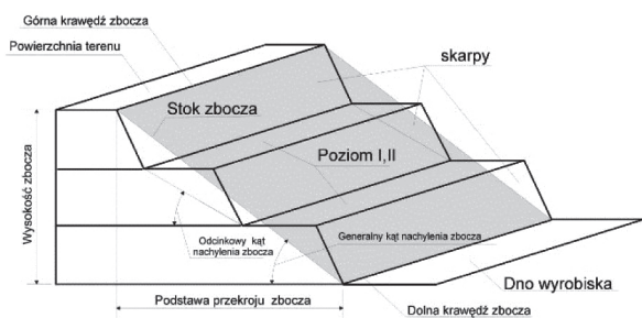
Rys. 4. Elementy budowy zbocza kopalni odkrywkowej