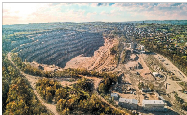
Rys. 1. Kopalnia Porfiru „Zalas”

Kopalnia „Zalas” (rys. 1) zajmuje się wydobyciem i przeróbką mechaniczną porfiru [1]. Jest to skała pochodzenia wulkanicznego, bardzo twarda i trudna w obróbce.