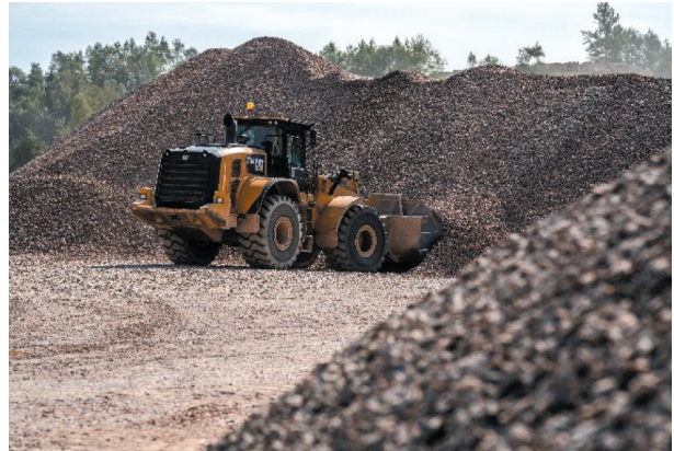
Rys. 17. Ładowarka podczas prac porządkowych

Ponadto ładowarki wykorzystywane są do wszelkich prac pomocniczych, takich jak: prace porządkowe (rys. 17), kształtowanie pryzm na placach składowych i magazynowych, utrzymanie bieżące dróg stałych i tymczasowych.