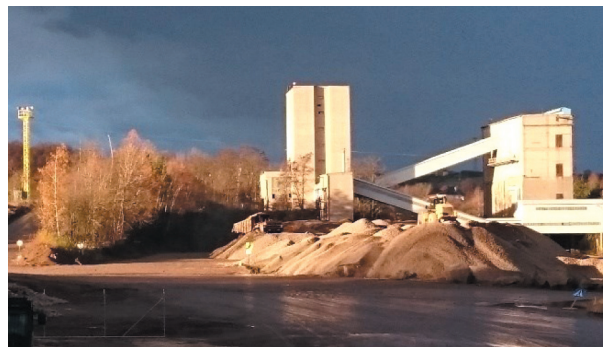
Rys. 15. Zakład przerobczy Kopalni Porfiru „Zalas”