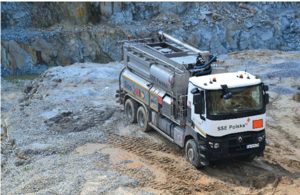
Rys. 7. Wóz strzałowy firmy SSE [6]

strzałowych ogłaszane jest odpowiednimi sygnałami dźwiękowymi i dopiero po ich nadaniu ludzie mogą opuścić miejsca bezpieczne – schrony.