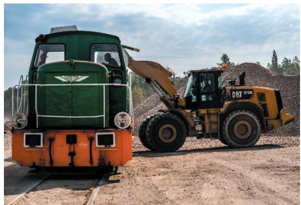
Rys. 18. Załadunek wagonów kolejowych