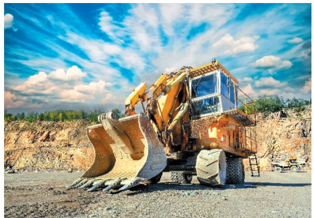
Rys. 11. Jednonaczyniowa hydrauliczna koparka przedsiębiorna Bola LB-600