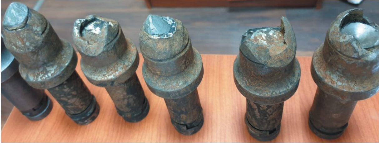
Rys. 2. Noże po jednej dobie urabiania nieznannej konkurencyjnej firmy

spotykają się w codziennej pracy. Stosowanie gorszych gatunków stali, słabszej jakości obróbki korpusu, nieodpowiedniej obróbki cieplnej zwiększającej kruchość korpusu czy też wadliwy sposób łączenia ostrza z korpusem noża (rys. 2 i 3).