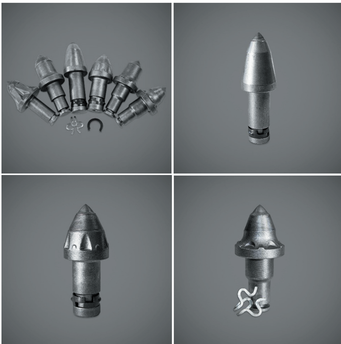
Rys. 1. Przykładowe noże firmy Betek [2]

Niezwykle ważnym elementem konstrukcji noża jest odpowiednia technika łączenia wkładki z węglików spiekanych z korpusem, jak również sam skład mieszanki lutowniczej, która jest wytwarzana na miejscu i stanowi tajemnicę firmy Betek. Wykonywane tym sposobem połączenie w stu procentach wypełnia przestrzeń między wkładką i korpusem noża. Ma to fundamentalne znaczenie dla trwałości noża oraz pomaga zapobiec sytuacji, w których dochodzi do wypadania wkładki w trakcie urabiania.