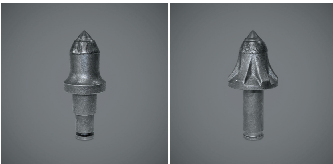
Rys. 5. Przykładowe noże firmy Betek z warstwą ochronną na części roboczej [2]

Generalnie każde wydłużenie żywotności narzędzi urabiających ma wpływ na zwiększanie wydajności całego systemu wydobywczego poprzez zmniejszenie częstotliwości ich wymiany.