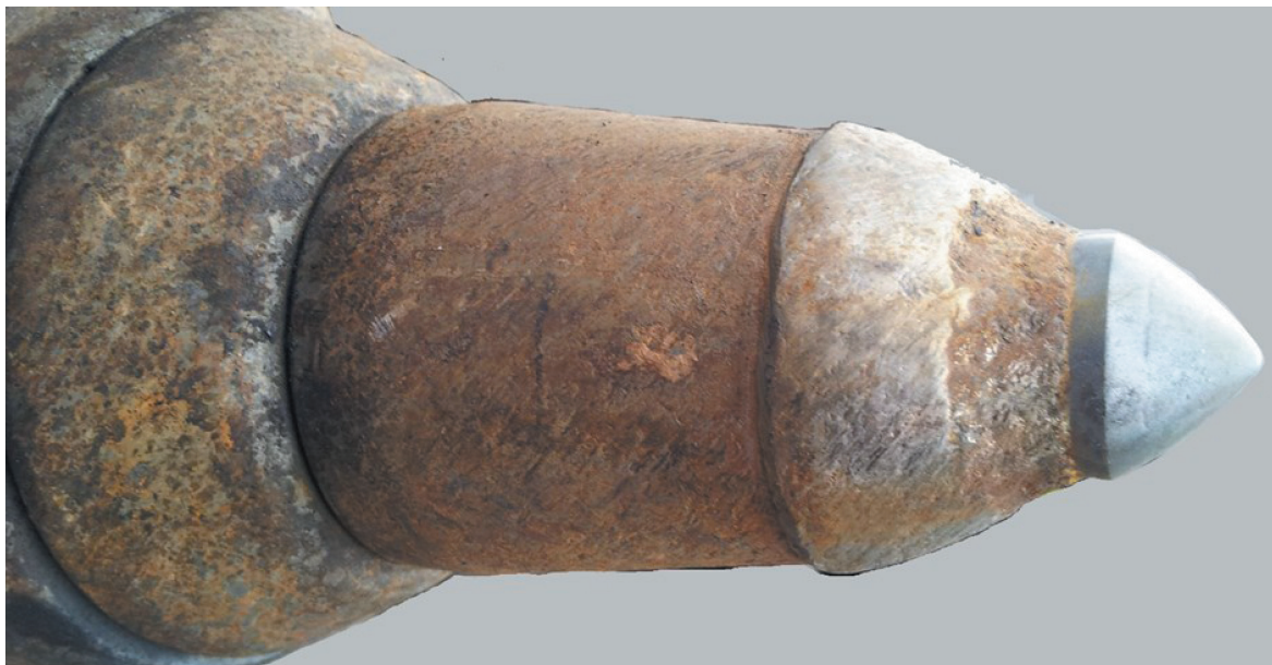
Rys. 4. Nieprawidłowe dobranie wielkości wkładki z węglików spiekanych do twardości korpusu oraz do warunków górniczych

części cylindrycznej (bez stożka). Co wskazuje, że została zabudowana bez potrzeby i tylko zwiększyło to koszt narzędzia.